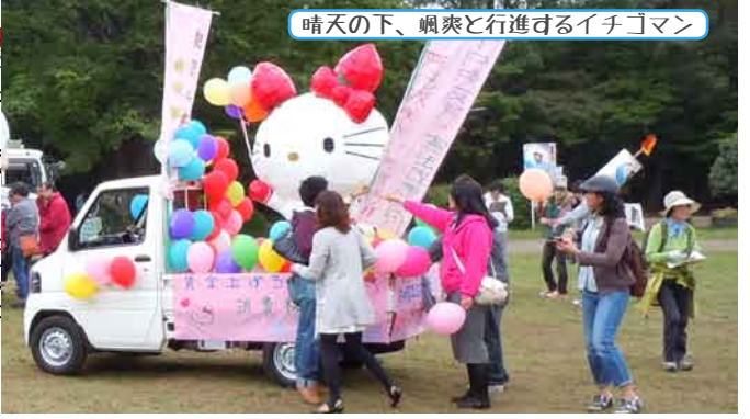
晴天の下、颯爽と行進するイチゴマン

初めは集まらなかつたが、この結果には正直納得が行つていません。当日は会場に着いた時、想像以上の規模に驚きました。特に僕らの目線は低めなので余計にその感じがします。デモの訴えも思つてます。