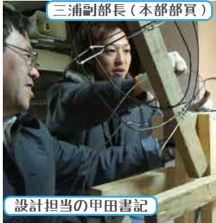
三浦副部長(本部部員)