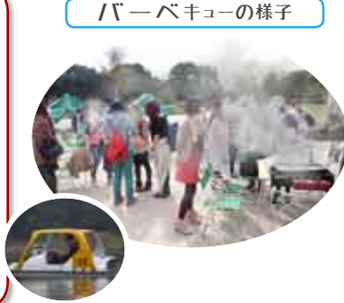
バーベキューの様子

支部で初となる後継者対策委員会による婚活パーティーに参加しました。青年部でも進展があったようです。貴重な体験でした。